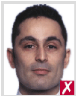
ไกลเกินไป